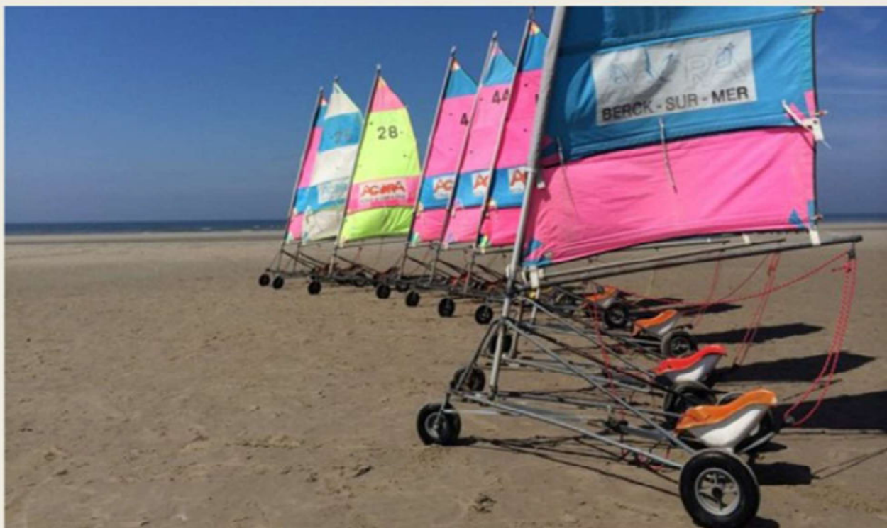
CHAR A VOILE